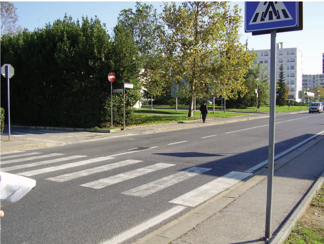
Foto 4: Vista incrocio Viale Togliatti -Via del Risorgimento tratto nord