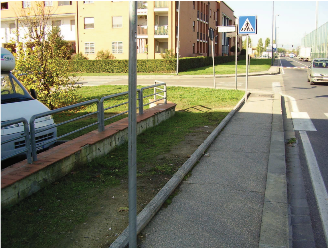
Foto 1: Vista incrocio Viale Togliatti -Via del Risorgimento tratto sud