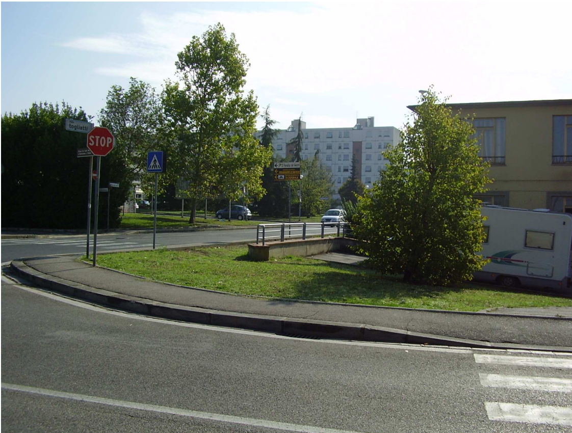
Foto 7: Vista della rampa derivata dalla biforcazione di Via del Risorgimento