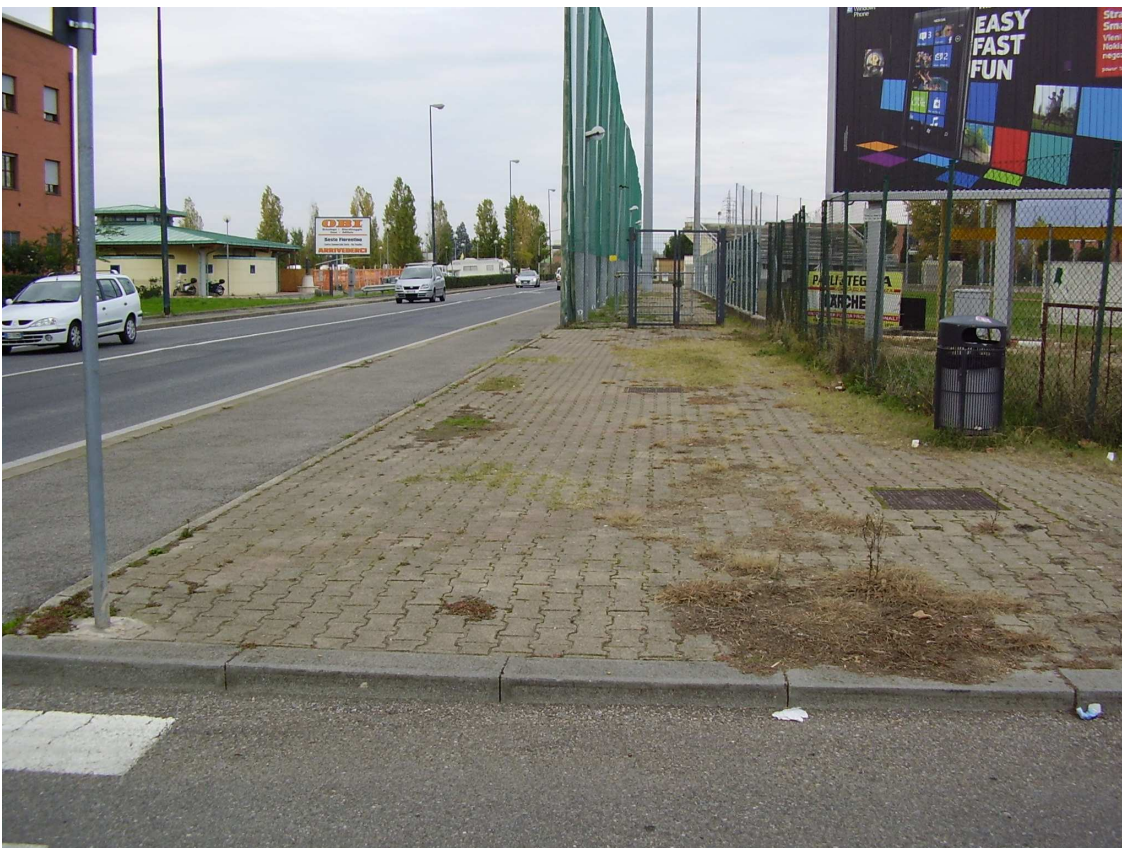
Foto 6: Vista marciapiede Viale Togliatti adiacente la recinzione del Campo di baseball